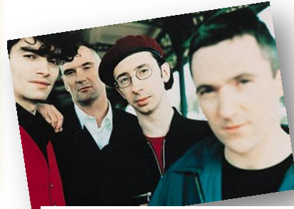
Les Innocents est un groupe de rock et de variété français formé en 1980. Cette chanson est extraite de l'album Fous à lier , paru en 1992